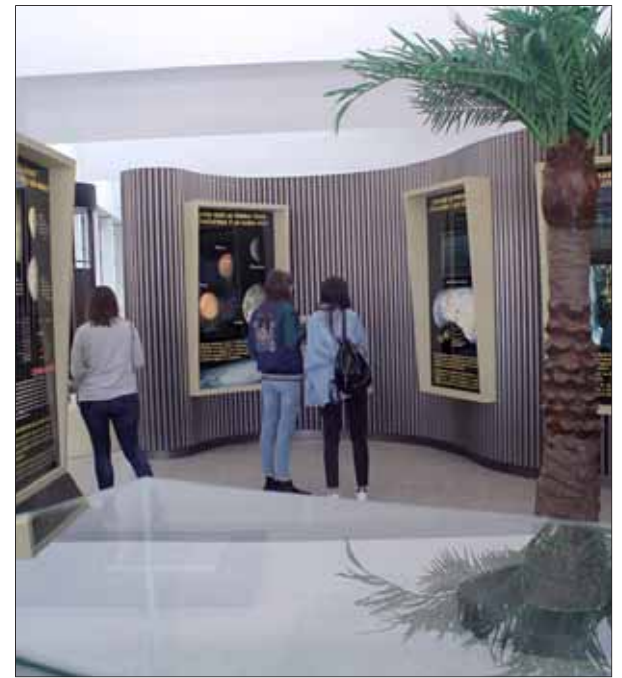
pasión del hombre por alcanzar las cimas más altas y lo que la montaña evoca en él desde antiguo. Sala de exposiciones temporales del MEH. Visitas didácticas a las 13 y las 19 horas.

De Excalibur a los agujeros negros. Una de las fuerzas que determina la estructura del cosmos es la gravedad. Esta exposición propone un viaje a al mundo en que vivimos y al Universo explorando multitud de fenómenos que dependen de la gravedad. Visitas didácticas a las 12.30 y a las 18.30 horas. Planta 2 del MEH. Entrada gratuita.