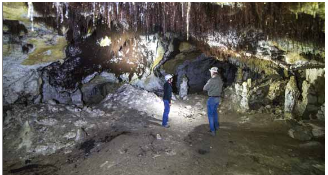
Vista general de Cueva Peluda.

Esta cueva es muy completa y accesible porque ofrece una imagen tridimensional de las cavidades. Señala Ortega que «al estar dentro de la visita turística, al inicio de la Trinchera, no ha sido necesaria mucha infraestructura para tener una entrada y hay yacimientos muy puntuales con lo que se puede abrir sin dañar el patrimonio y además es la