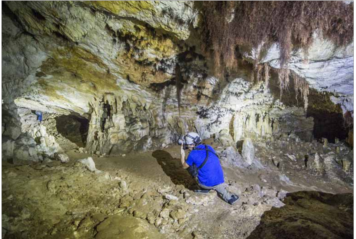
Interior de Cueva Peluda donde el agua aún está en proceso de formación de estalagmitas y las raíces de robles y quejigos llegan aquí como finos hilos.