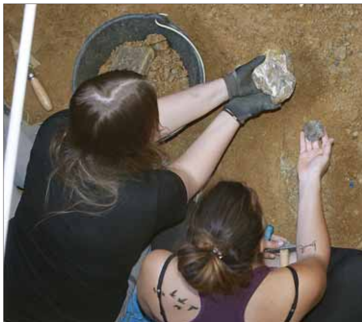
Detalles de los trabajos en el yacimiento.