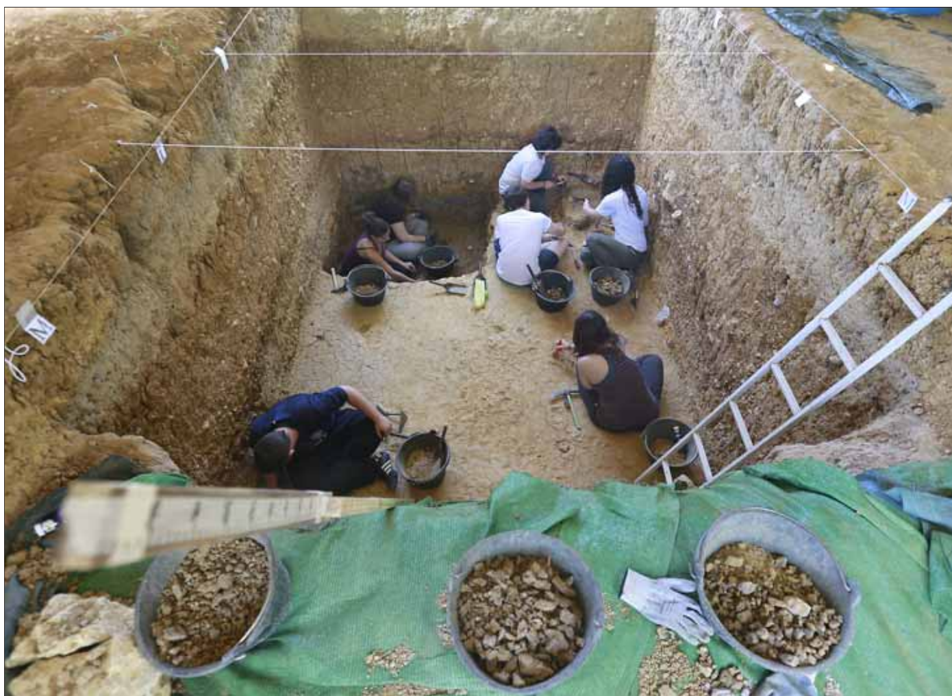
Imagen de investigadores en el interior del yacimiento. RAÚL G. OCHOA