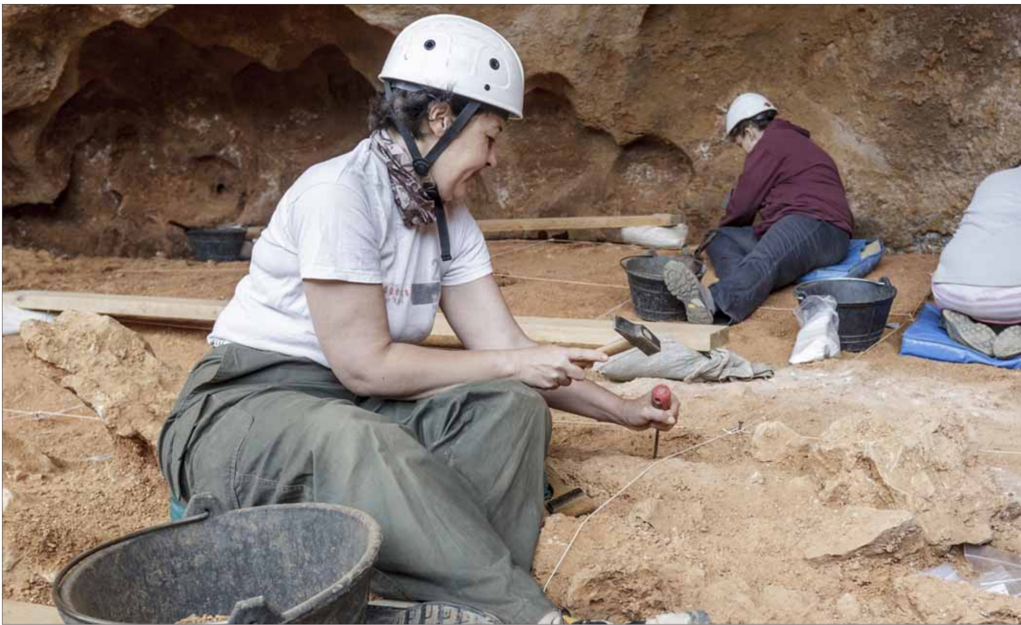
Tres personas desarrollan labores de excavación en el yacimiento de Galería en la Sierra de Atapuerca. SANTI OTERO